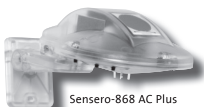
Sensero-868 AC Plus